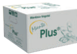
Mante Plus manteca

Margarina y manteca para múltiples usos en repostería, panadería y gastronomía en general. Presentaciones de 15 kg, 27.5 kg y 50 kg.