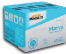
Marva margarina vegetal simple