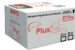
Marga Plus margarina