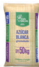
Azúcar Blanca San Carlos

Azúcar blanca de grano fino o de grano grueso en presentación de 50 kg.