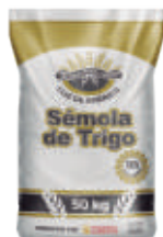
Sémola de trigo