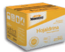
Hojaldrina margarina para hojaldre