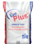
Harina Key Plus